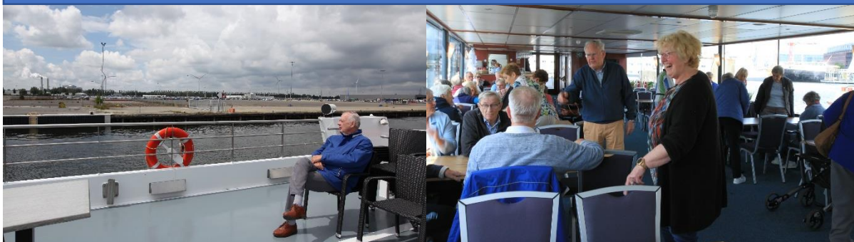
Er was genoeg tijd voor even rustig te genieten of gezellig samen iets te drinken en of te eten.